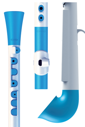
Dood, Toot & jSax